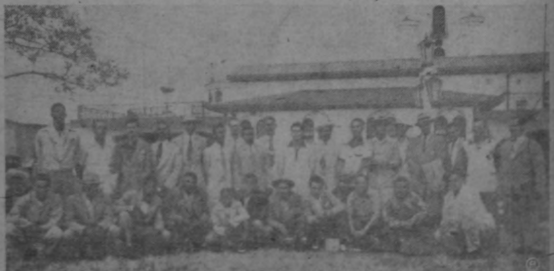
Delegación panameña de fútbol, que ayer llegó por vía aérea.—Foto Arévalo).