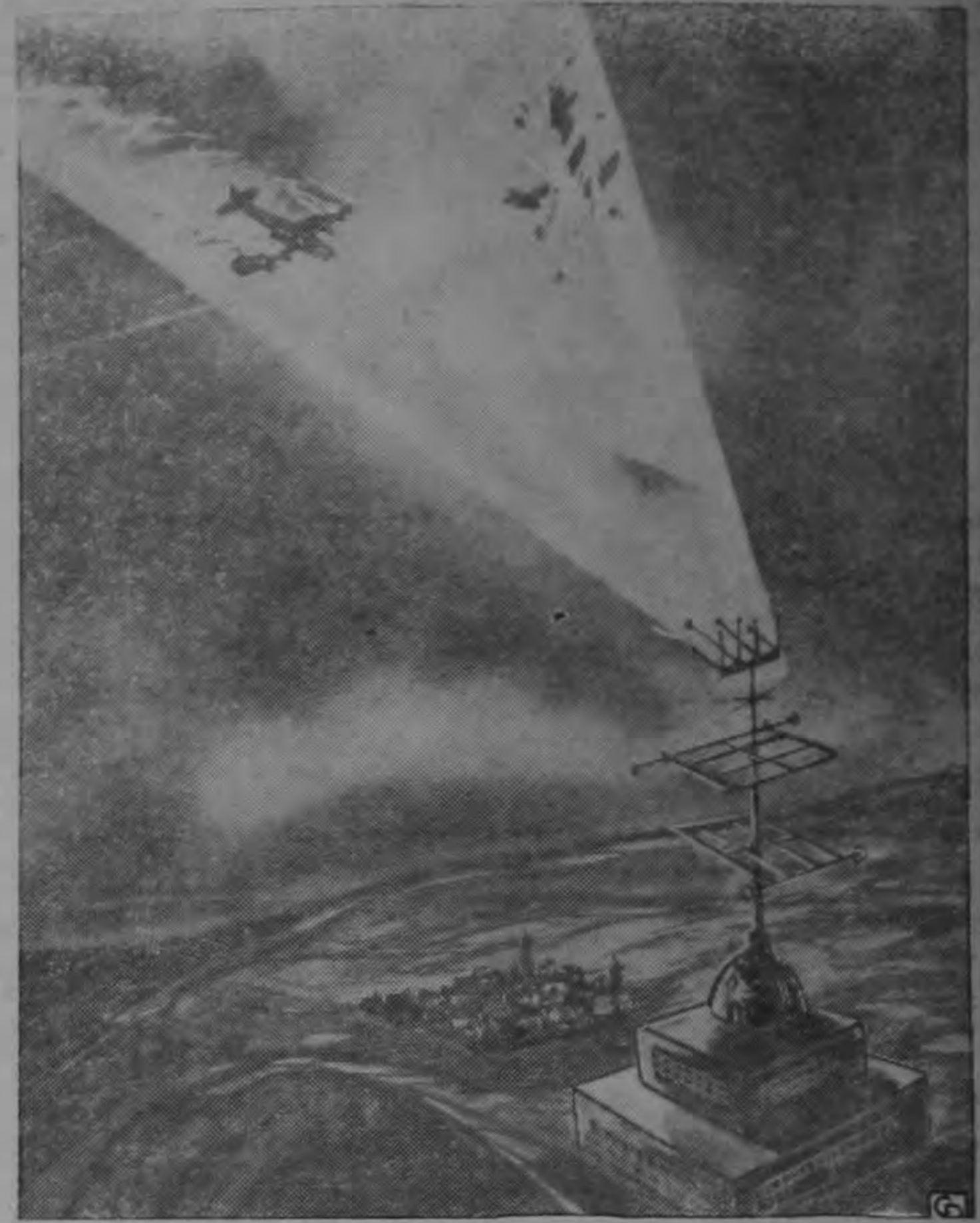
Esta es una concepción artística de un "rayo de la muerte" en acción.

Sin embargo, los hombres de ciencia se inclinan a creer que si existe de hecho una base para los relatos de que testigos presenciales vieron aviones rusos di-