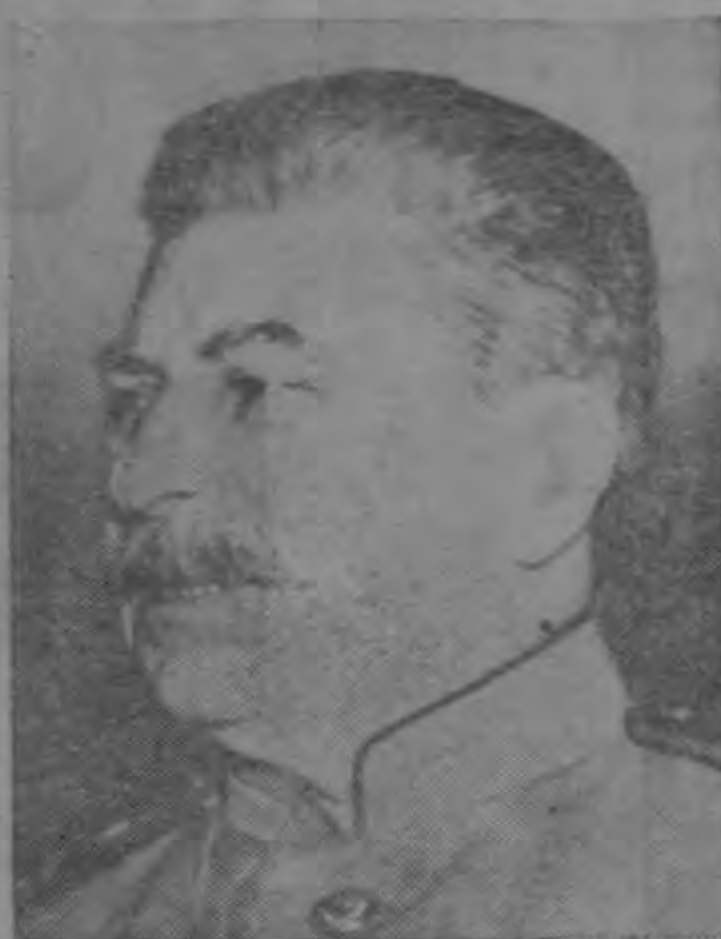
"...Ya no gobierna Rusia..."

La historia moderna testifica que el moderado gobierno Kerensky fué derrocado el siguiente octubre por los rojos. Para entonces Stalin tenía un socio en la publicación de Pravda— Nicolai Lenin, cuyo padrazgo ayudó a Josef a ser elegido Secretario General del Partido comunista en 1922. Y cuando Lenin falleció dos años más tarde su poderío material quedó distribuido entre Stalin, Kamenev y Zinoviev aunque Trotzky aparecía como la primera potencia de Moscú ante los ojos del mundo exterior.